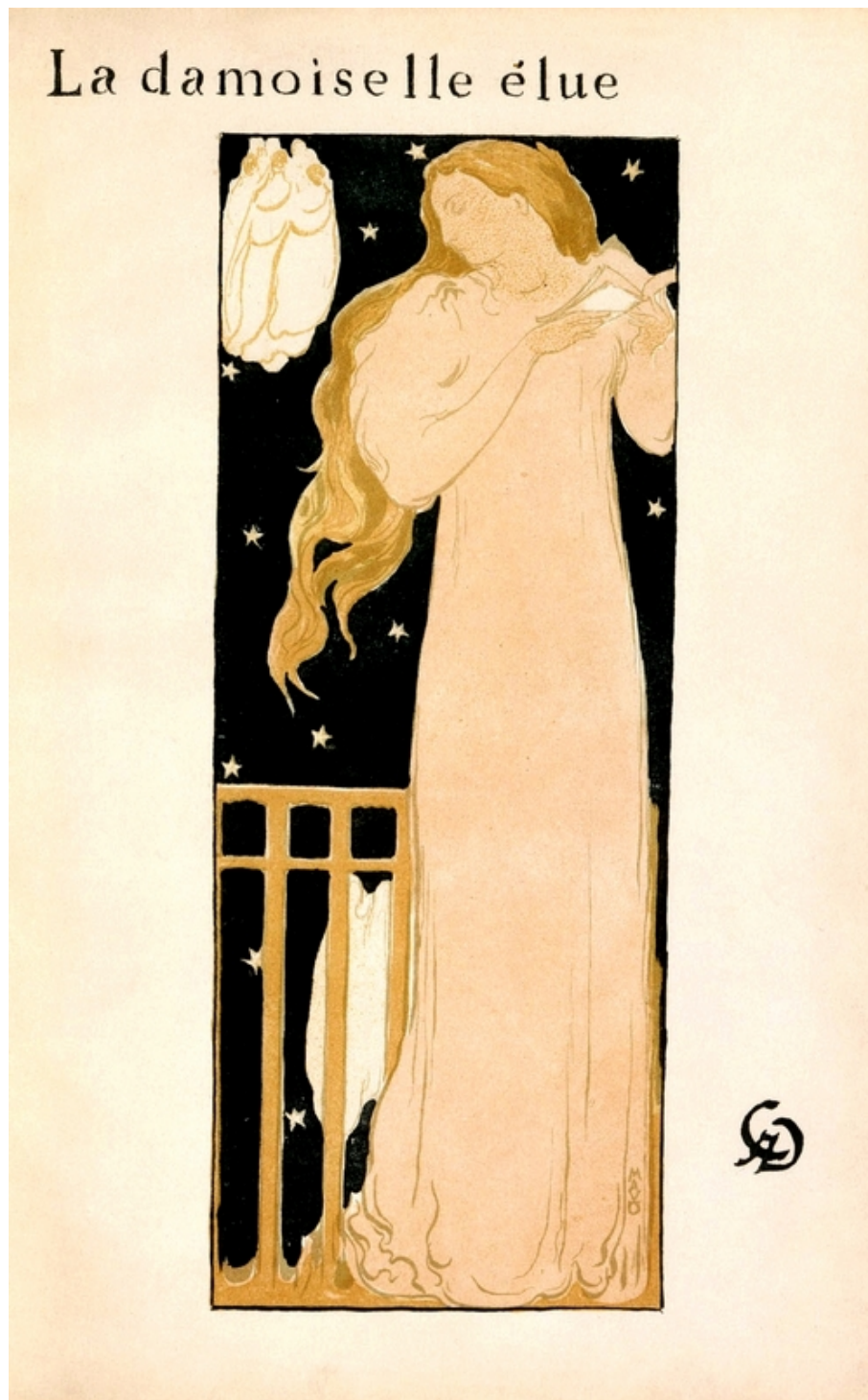
Maurice Denis, frontispice pour La Damoiselle élue de Debussy.