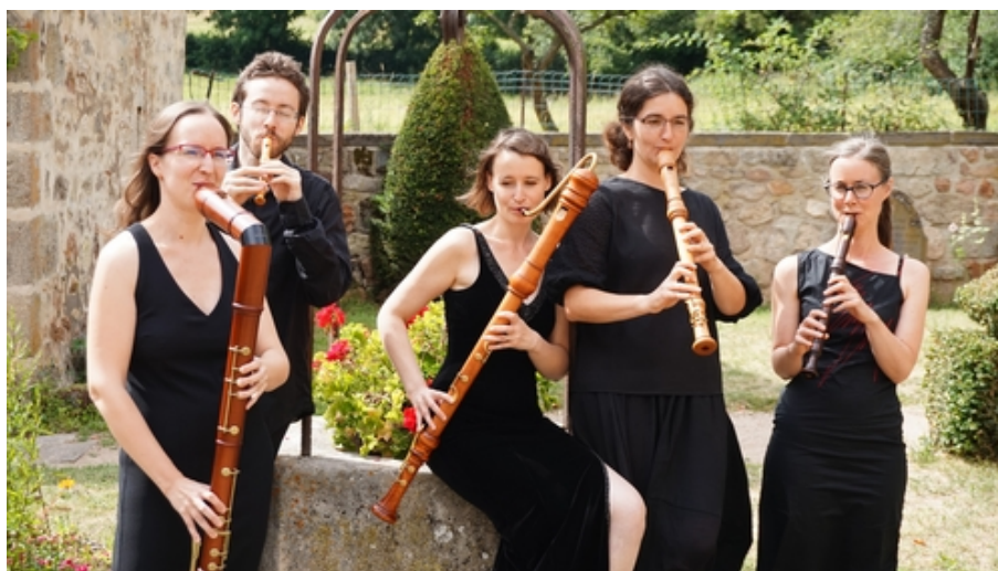
Le quintette « Les Baroqueurs du XVIIIème ».

Le jeune public eut, quant à lui, rendez-vous pour des jeux d'énigmes et d'écriture avec les médiateurs du Musée.