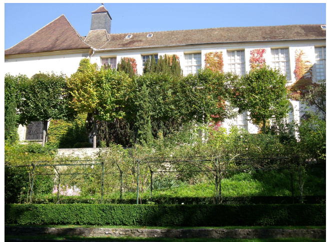
Le musée Maurice Denis