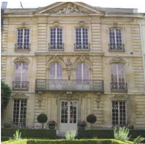
Le musée Lambinet

Ces visites couplées seront aussi l'occasion de connaître deux lieux chargés d'histoire et de culture.