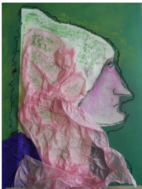
Profil réalisé par Emilie.

Qu'ils aient ou non déjà pratiqué dessin ou peinture, les résidents sont invités à participer par petits groupes (entre cinq et dix personnes) à un atelier « dessin » chaque fois différent.